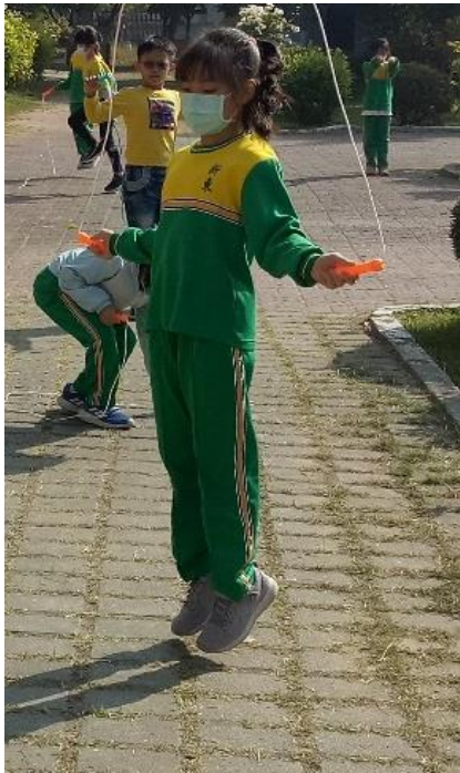
說明：我會每天運動30分鐘