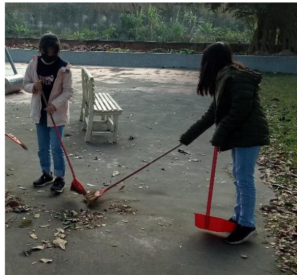
說明：我會維護環境的整潔