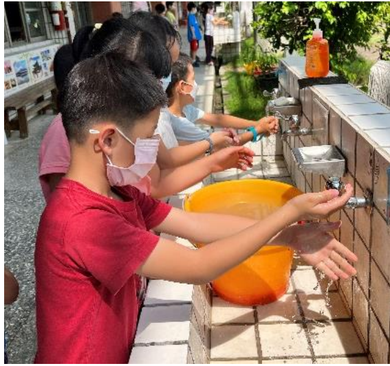
說明：我會正確的洗手