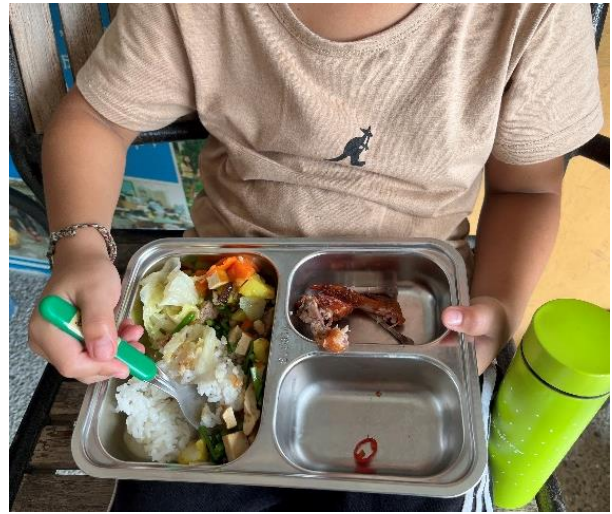
說明：我會天天五蔬果